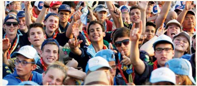
[世界スカウトジャンボリー]

仲間が集まるジャンボリー 4年に1回、世界のスカウトの代表が集まる世界スカウトジャンボリー、国内・海外の代表が集まる日本ジャンボリーが開かれキャンプを行いながら交流を深めます。 2015年には、34,000人のスカウトが集まり、日本で世界スカウトジャンボリーが開催されました。