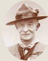
創始者 ロバート・ペーデン・パウエル

ボーイスカウト運動は1907年、イギリスから始まり世界中に拡がり、現在では世界の161の国と地域が正式加盟、約4,000万人ものスカウトが参加しています。社会教育団体としては他に例を見ないほど国際性を持ち、その意義が広く認められています。環境教育や国際理解・国際協力のプログラムを積極的に展開し、国連の諸機関と協力し、国際協力活動も行っています。