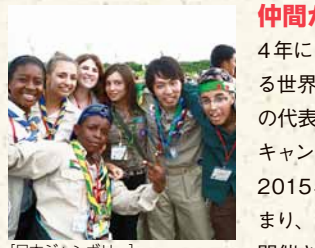
[日本ジャンボリー]

仲間が集まるジャンボリー 4年に1回、世界のスカウトの代表が集まる世界スカウトジャンボリー、国内・海外の代表が集まる日本ジャンボリーが開かれキャンプを行いながら交流を深めます。 2015年には、34,000人のスカウトが集まり、日本で世界スカウトジャンボリーが開催されました。