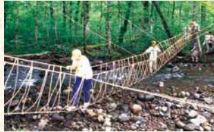
[モンキーブリッジ]

テントの張り方、地図の読み方、炊事や工作、自然観察などを楽しく学びます。また、自分のためだけでなく、奉仕の精神を持ち、人のために役に立つことの大切さを学びます。